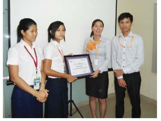
បុគ្គលិក ហ្វឹស ហ្វាយនែន ផ្ដល់ប័ណចូលរួមដល់សិស្ស និងនិស្សិត PSE