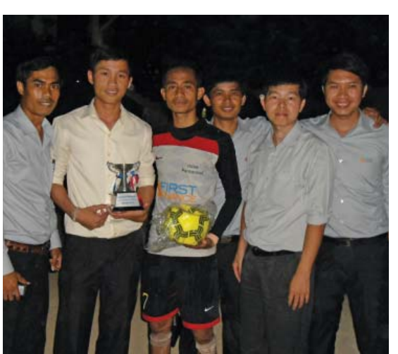
ក្រុមបាល់ទាត់ PSE ឧបត្ថម្ភដោយហ្វឹស ហ្វាយនែន